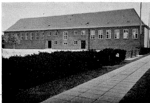
Den ny Gymnastikbygning.

for 5te, 6te og 7de Klasserne, mens Undervisningen for 1ste, 2den og 3die Klasserne midlertidigt ophævedes. Fra 6te Marts og Resten af Skoleaaret fik 2den & 3die Klasse Hverdagsundervisning, medens 1ste Klasse sammen med de ældste Klasser i den eksamensfri Mellemskole undervistes hveranden Dag. Dog havde 4de Klasse i denne Afdeling sammen med Eksamensmellemskolens Klasser i hele Perioden Hverdagsundervisning. Først paa det ny Skoleaar (9de April) kunde der atter arbejdes for fuld Kraft. Paa Grund af Indskrænkningerne i Undervisningen afholdtes der i Aar ingen Aarsprøve.