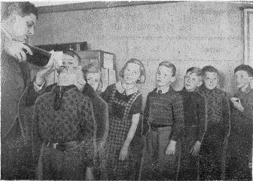
Der serveres Levertran.

Iøvrigt har Skolelægen afgivet udførlig Beretning om Virksomheden til Skolekommissionen.